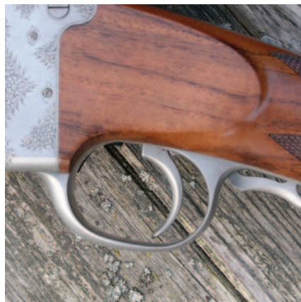
▲ | ...Waffe gespannt

cm-Lauf) solide 3,2 Kilogramm. Selbst die mit der rasanten, kräftigen 7x75R Super Express vom Hofe versehene Testwaffe schoss durch die Mehrmasse auch