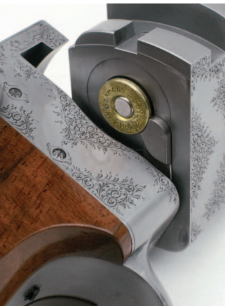
▲ | Blick auf die Lagerseite: Dachblocknut, Auszieher.

Alois Mayr ist Kundenwünschen sehr aufgeschlossen. Er verfügt über eine eigene CNC Fräsmaschine mit gesteuertem Teilapparat und kann sämtliche Teile inklusive der Waffenangepassten, äußerst niedrigen Zielfernrohrmontage selbst fertigen. ■