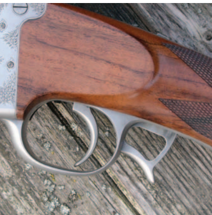
▲ | Waffe entspannt...